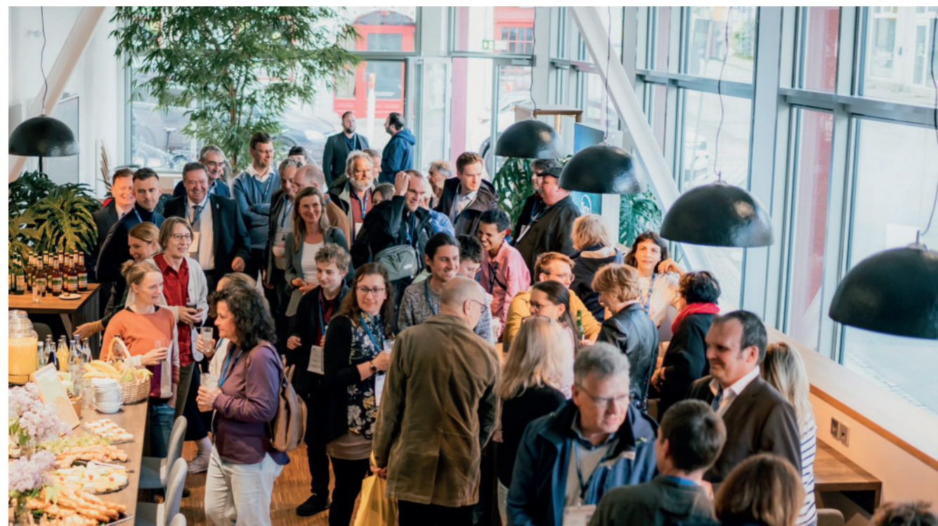
Netzwerkabend zur Dialogreise durch Saalfeld-Rudolstadt