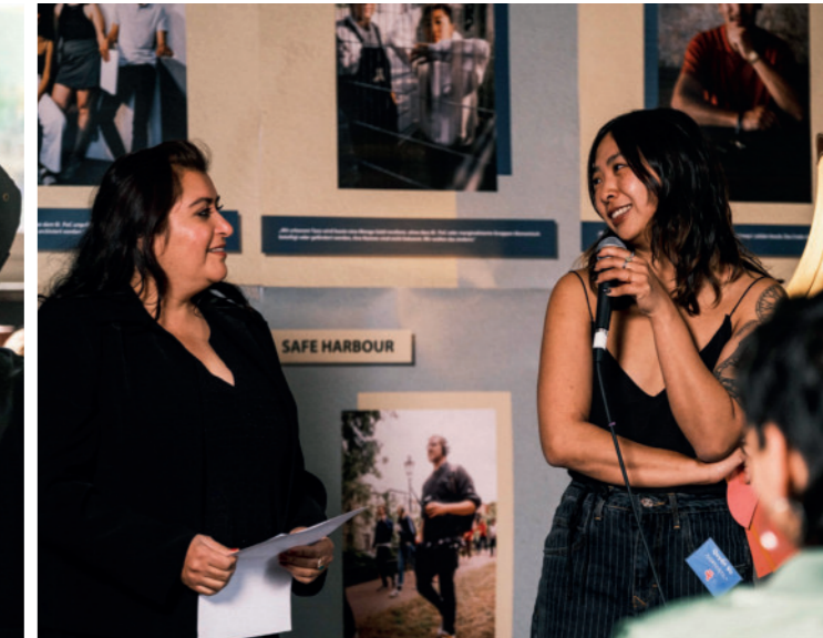
Vernissage der Wanderausstellung

JUGENDSTIL* hat 2025 über 80 Beratungen mit jungen, (p)ostmigrantischen Initiativen durchgeführt.