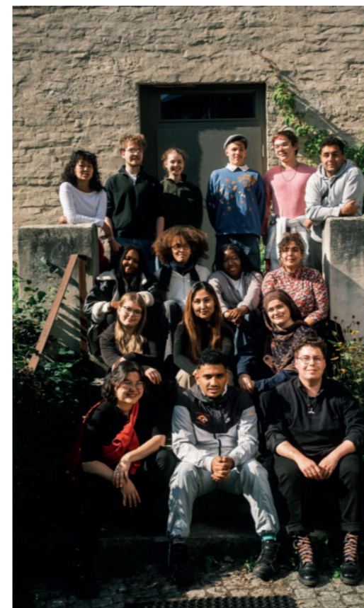
Treffen der Jugendjurs von JUGENDSTIL* und dem Gen Ost JugendFonds in Potsdam