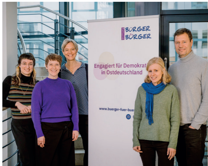
Das Leitungsteam der Stiftung Bürger für Bürger

Und so bleiben wir entschlossen, zuversichtlich und gemeinsam: Engagiert für Demokratie in Ostdeutschland.