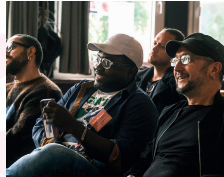
Vernissage der Wanderausstellung