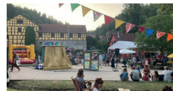
Brot und Blumen

Bei knapp drei Vierteln der Projekte berichteten Engagierte von spürbaren Veränderungen im Miteinander vor Ort, wie in Uhlstädt-Kirchhasel in Thüringen: