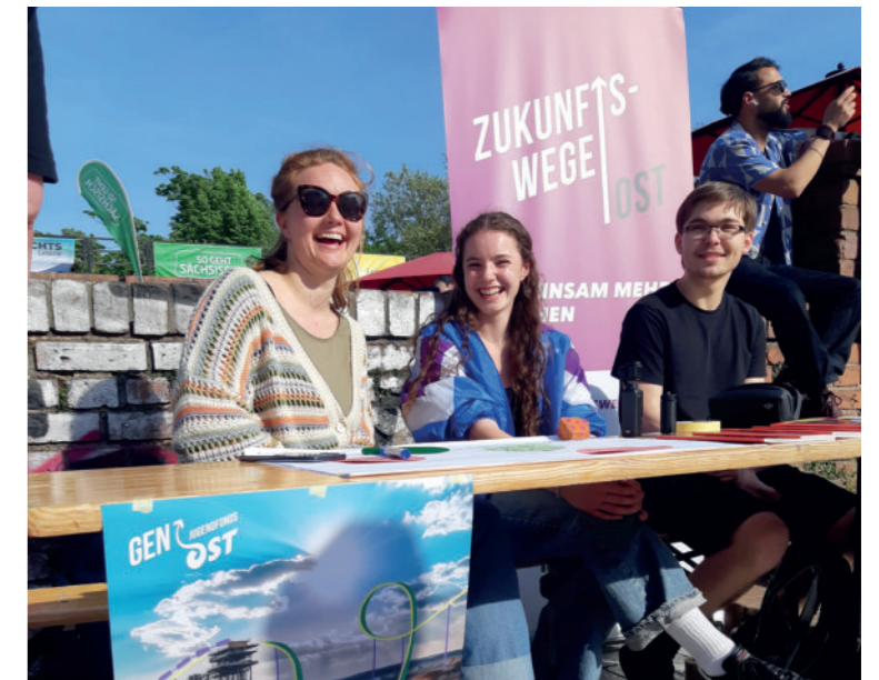
Gen Ost Launch bei "Leipzig zeigt Courage"

12 engagierte Jugendjurymitglieder zwischen 15 und 26 Jahre