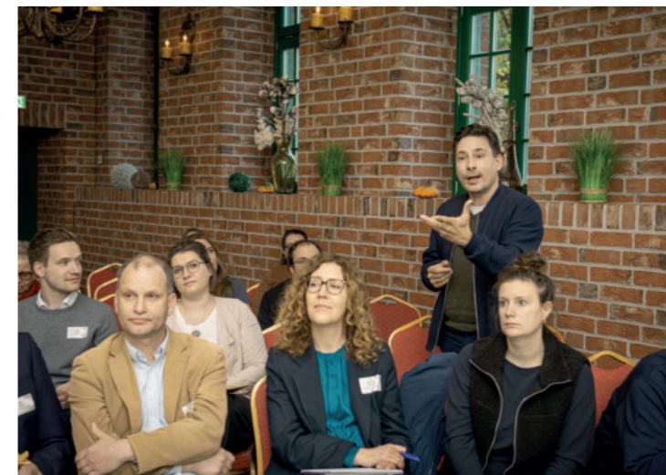
Forum Bürgergesellschaft 2025

Bei unserem Lunchmeeting beim Deutschen Stiftungstag 2025 in Wiesbaden haben wir gemeinsam mit bestehenden Förderpartner:innen und interessierten Stiftungsvertreter:innen auf das erste Jahr Zukunftswege Ost angestoßen, zurückgeblickt und neue Impulse für die Weiterentwicklung der Gemeinschaftsinitiative mitgenommen.