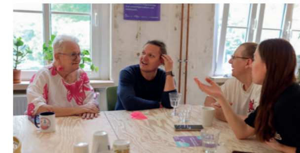
Café Zukunft

In 9 von 10 Projekten entstanden laut Angaben der Engagierten neue Kontakte und Kooperationen, bei mehr als der Hälfte auch mit kommunalen bzw. institutionellen Akteur:innen, bei einem Fünftel mit wirtschaftlichen Partner:innen. In 8 von 10 Projekten wurden Aktivitäten über die Projektlaufzeit hinaus fortgeführt. Wie sich das verbindet, zeigt Stadt mit Zukunft Angermünde e.V. in Mecklenburg-Vorpommern: