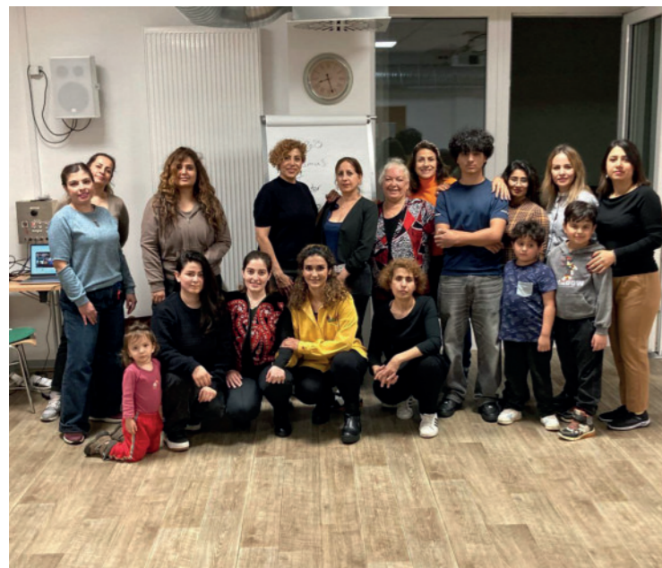
Maisams Rassismus Workshop