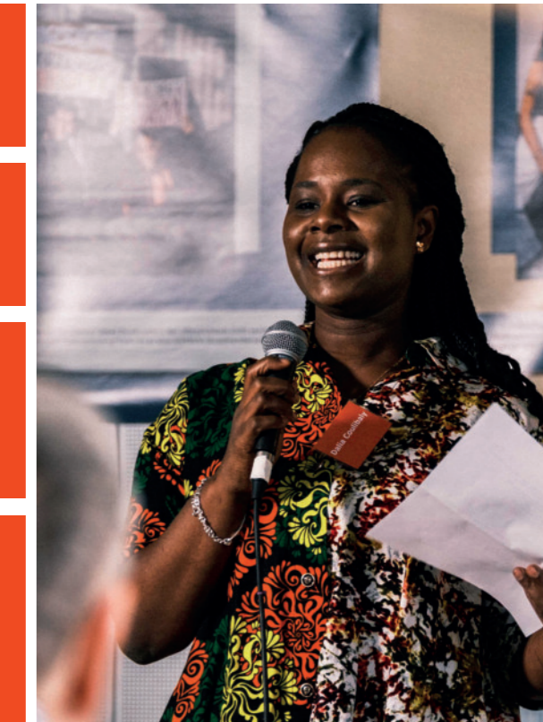
Vernissage der Wanderausstellung

Der von JUGENDSTIL* unterstützte Spielfilm „Lönig und Havendel“, ein deutsch-vietnamesisches Erzgebirgs-Märchen, feierte 2025 Premiere und wurde u. a. mit dem Max Ophüls Preis ausgezeichnet.