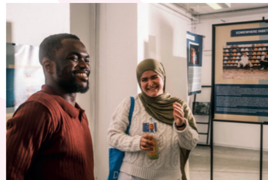
Wanderausstellung © Miguel Löhmann

Die Wanderausstellung „Trotz allem! Postmigrantische Jugend bewegt den Osten“ zog auch 2025 durch die Lande und wurde u. a. in Görlitz, Berlin und Potsdam gezeigt. In Potsdam wurde die Ausstellung mit Portraits junger (p)ostmigrantisch Engagierter mit einer feierlichen Vernissage im Rahmen der Interkulturellen Wochen eröffnet. Die Gäste erfuhren an diesem Abend durch Interviews und poetische Beiträge mehr zur