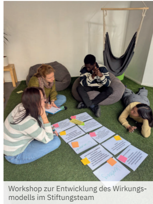
Workshop zur Entwicklung des Wirkungsmodells im Stiftungsteam

Dank der Förderung durch den ZukunftsWirkungs-Fonds der DSEE und Mitteln der Postcode Lotterie können wir mit Wirkungswege Ost diesen Schritt aus der Stiftung herausgehen. Im Projektzeitraum etablieren wir Wirkungsorientierung als gemeinsame Haltung und bauen Wirkungsmanagement als Querschnittsaufgabe auf. Seit April 2025 stellen Team und Gremien in einem mehrmonatigen Prozess im Rahmen von Workshops und Arbeitsgruppen die Weichen: Wo wollen wir hin und woran erkennen wir, dass wir unsere Ziele erreichen? Ergebnis ist ein organisationsweites Wirkungsmodell, das unsere Ansätze und angestrebten Wirkungen in ihren Zusammenhängen abbildet und als Grundlage für Planung, Steuerung und Kommunikation dient.