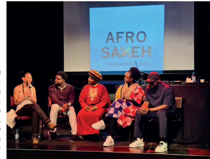
AfroSax Empowerment Hub

Mit Unterstützung des Ideenfonds konnte sich der AfroSax Empowerment Hub in Sachsen eine Vereinsstruktur aufbauen. Die Initiative stärkt Schwarze Communities durch Angebote wie Mentoringprogramme, kulturelle Veranstaltungen und berufliche Vernetzung. Damit leistet sie einen wichtigen Beitrag zur nachhaltigen Stärkung zivilgesellschaftlicher Strukturen in Ostdeutschland.