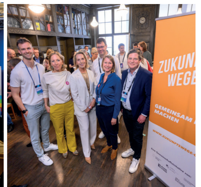
Lunchmeeting Zukunftswege Ost beim DST25