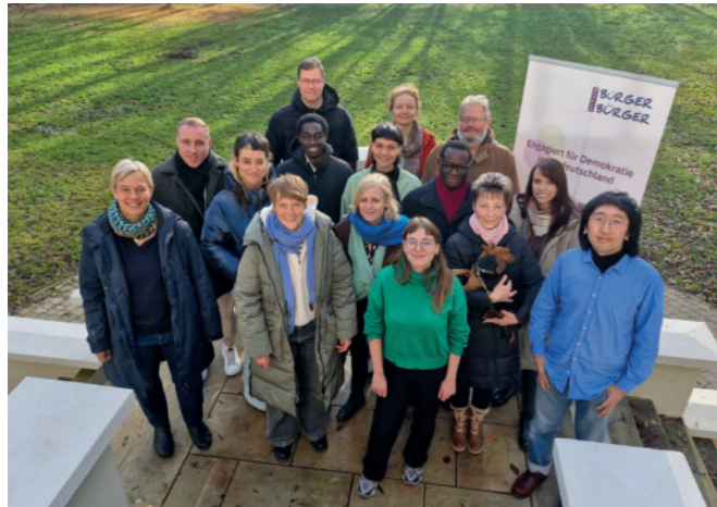
Team und Vorstand der Stiftung Bürger für Bürger