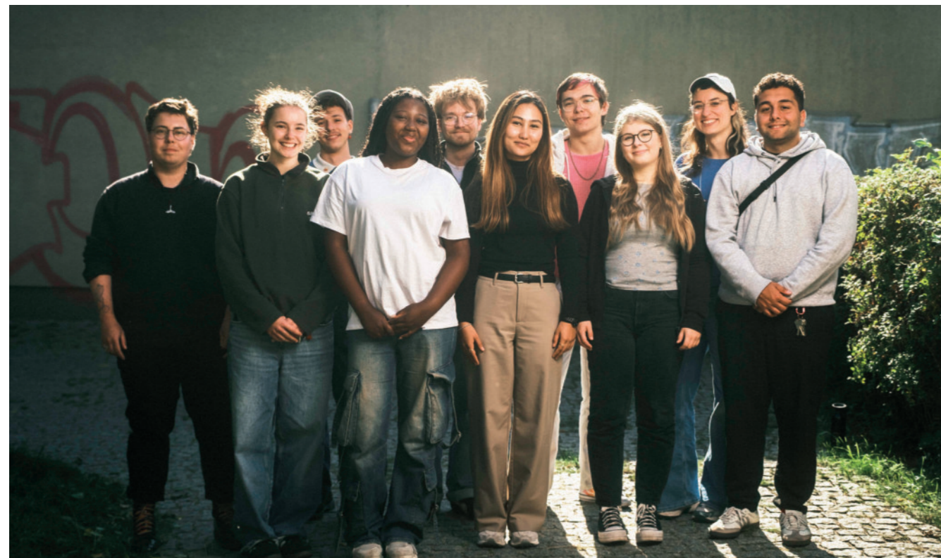
Unsere Gen Ost Jugendjury

„Der Weg, den ich bisher gegangen bin, hat mir gezeigt, wie wichtig Unterstützung und Sichtbarkeit für Menschen sind, die nicht immer dieselben Startvoraussetzungen haben.“ – über zwanzig bewegende Bewerbungen erreichten uns zur Beteiligung an der Jugendjury. Wir besetzten nach größtmöglicher Diversität und konnten auf unserer Auftaktsitzung im April gemeinsam erste Kriterien und Prozesse festlegen, die in den folgenden Förderrunden reflektiert und mit praktischer Erfahrung geschärft wurden.