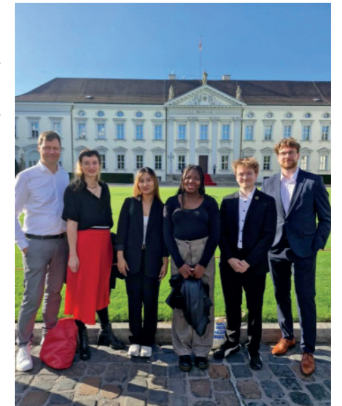
Junge Menschen mitnehmen – wie zum Bürgerfest des Bundespräsidenten am 12. September im Schloss Bellevue