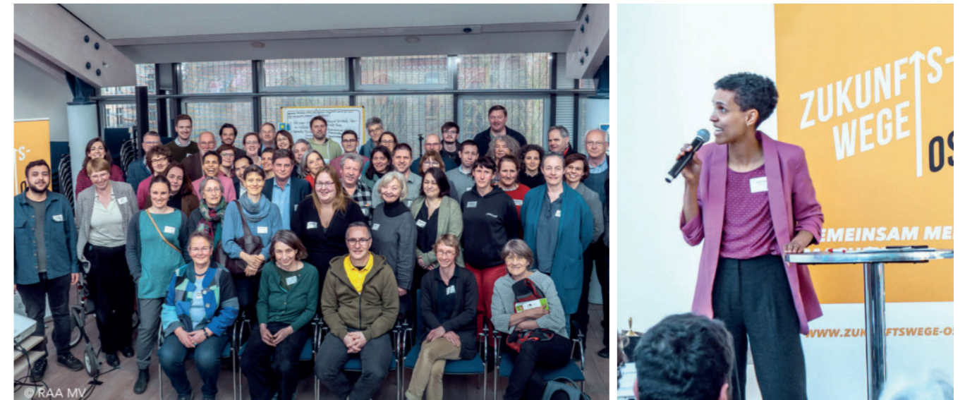
Der Kickoff der Fokusregion Vorpommern brachte viele Akteur:innen aus der Region zusammen

Zum Start der Fokusregion Vorpommern im März brachten sich 80 interessierte Personen aus Zivilgesellschaft, Verwaltung und Politik, Stiftungen, Wirtschaft und Wissenschaft in die Strategieentwicklung ein. Die dort erarbeiteten Formate für Dialog und Bürgerbeteiligung wurden zum Netzwerktreffen Mitte des Jahres in Lassan im Landkreis Vorpommern-Greifswald mit 45 Teilnehmenden weiter bearbeitet. Auf dem Podium der Zukunftswege Ost -Ideenwerkstatt bei der Tagespiegel-Konferenz „Der Osten“ konnte sich die Fokusregion Vorpommern vor einem bundesweiten Publikum mit ihren Themen präsentieren.