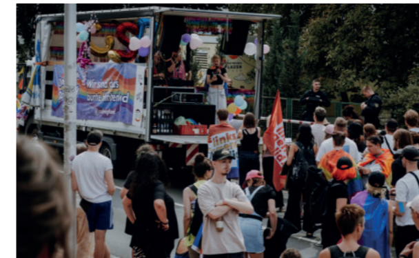
CSD Plauen

In 9 von 10 Projekten berichten Engagierte, dass sie neue Fähigkeiten aufbauen oder bestehende Kompetenzen erweitern konnten. Bei fast zwei Dritteln wurde das Engagement dabei stärker öffentlich wahrgenommen. Die Initiative CSD Plauen zeigt in Sachsen, wie das aussehen kann: