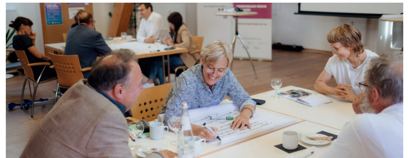
Roundtable Brandenburg

In Sachsen-Anhalt und Brandenburg fanden Roundtables mit überregionalen und lokalen Akteur:innen statt, um mögliche Fokusregionen und Bedarfe zu identifizieren. So werden 2026 Fokusregionen in der Altmark und der Uckermark entstehen, wodurch die Strukturförderung von Zukunftswege Ost in allen fünf ostdeutschen Flächenländern ihre Wirkung entfalten kann.